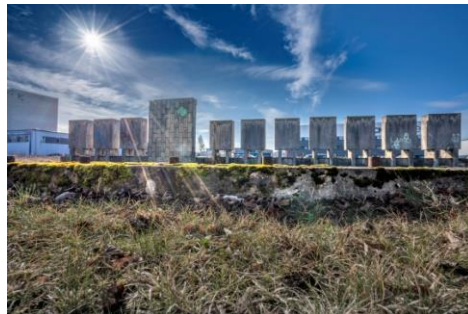
INKARO“ STOUNHENDŽAS, Dariaus Petrulio fotografijos. 2020.

Šiandien „Inkaro“ teritorijoje tarp daugybės naujai įsikūrusių mažų ir didelių įmonių galima atrasti alternatyvių takų. Štai vienas žolėje pramintas keliukas veda link keisto objekto – ritmingai besikartojančių betono stačiakampių. Šis „Inkaro“ Stounhendžas – buvusi fabriko garbės lenta. Išlikęs ir fabriko 50 metų jubiliejų ženklinantis atminimo akmuo. O vienos mašinų stovėjimo aikštelės teritorijoje po žeme ateities archeologų laukia „Inkaro“ archyvai ir techninės bibliotekos lobis, palaidotas ten prieš kelis dešimtmečius.