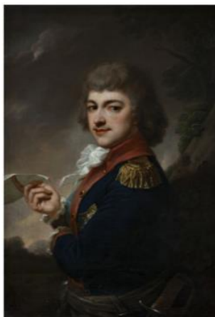
Mykolas Kleopas Oginskis (1765–1833)

Pasisukęs šonu į dešinę stovi jaunas vyras, apsirėdęs karininko uniforma. Jo galva trimis ketvirčiais atsukta į žiūrovą. Akys didelės, rudos, vešlūs antakiai, nosis tiesi, putlios raudonos lūpos, plaukai garbanoti, pilkai rusvi. Tamsiai mėlynas švarkas puoštas raudonais rankogaliais, užsegimo kraštais ir apykakle, auksinėmis sagomis, antpečiais su ilgais kutais. Juosmenį juosia platus diržas, matyti prikabinto kalavijo rankenos fragmentas. Po kaklu – baltas surauktas žabo. Rankos priglaustos prie krūtinės, ant iškelto dešinės rankos piršto – popieriaus lapas. Fone – tamsiai pilkas debesuotas dangus, dešinėje – status šlaitas, vietomis apaugęs žaliais krūmeliais