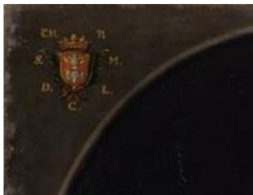
Pacų giminės herbas.