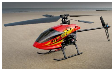
Pirmasis skrydis su sraigtasparnio modeliu

Instruktorius paruošia sraigtasparnį skrydžiui, padeda jį į paruoštą skraidymo aikštelę. EP dalyviai stebi skrydžius saugiu atstumu nuo pakilimo aikštelės. Modelis sukalibruojamas, EP dalyviai paeiliui bando pakilti ir skristi iki instruktoriaus užduoto „taikinio“ bei grįžti į pakilimo vietą. Po skridimų instruktorius ir EP dalyviai analizuoja besimokančiųjų veiksmus, instruktorius pataria, kaip lengviau išvengti dažnai daromų klaidų, moksleiviai tarpusavyje dalijasi patirtais įspūdziais.