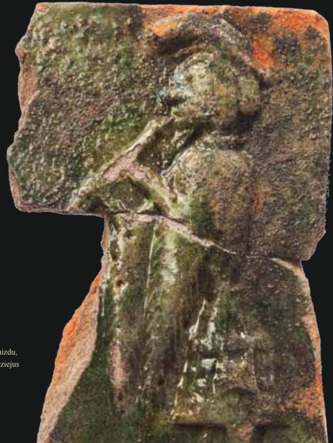
Koklis su muzikanto atvaizdu, XV a., Valdovų rūmų muziejus