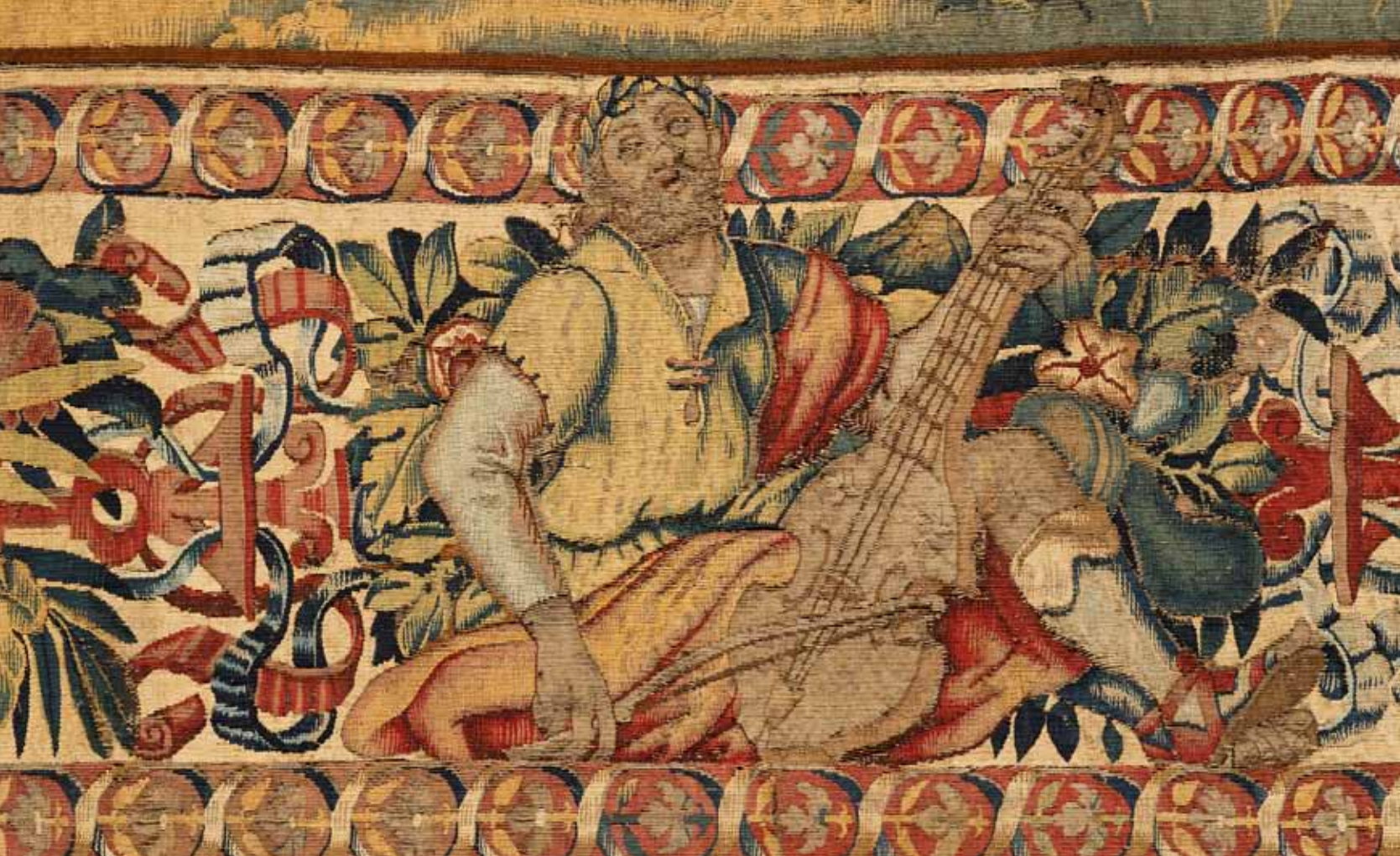
Gobeleno „Odisejo atsisveikinimas su žmona ir tėvais“ fragmentas, Flandrija, Briuselis, apie 1570 m., Valdovų rūmų muziejus