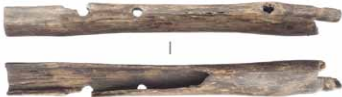
Medinė fleita, XIV–XV a., Valdovų rūmų muziejus

Šventasis Raštas liudija, kad nuo pat pasaulio pradžios būta daugybės žmonių, besidžiaugusių muzika. Ne tik šventieji tekstai, bet ir pasaulietiniai Antikos veikalai teigia, kad per visus amžius garsėjantys vyrai ją ypač aukštai vertino. Iš tikrųjų, kai jie patyrė, kad muzikos jėga jų mintis kilsteri aukščiau prie Dievo, kurį jie pripažino visų daiktų Kūrėju bei visokių gėrybių šaltiniu, ir kai jie įvertino, kad jų pašlovinimai, himnai ir giesmės dėl proto smarkesnio sužadavimo, kylančio iš muzikos galios, bus Jam malonesni, tai Dievo Asmuo ir imtas aukštinti tokios rūšies pašlovinimais. Priėjęs prie tokios minties, garsusis Dievo tautos vadovas Mozė už didžią savo pergalę prieš Egipto karalių Visagaliui Dievui pagiedojo kuo džiaugsmingiausią pajaną. Ir nenugalimasis karalius Dovydas nusprendė Dievą šlovinti giesmėmis, į šlovinimą įmaišant įvairių, taip pat ir grakščių muzikos instrumentų,