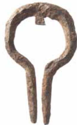
Dambrelė, XIV–XV a., Valdovų rūmų muziejus

Paveikti tokių štai priešasčių, senovės poetai