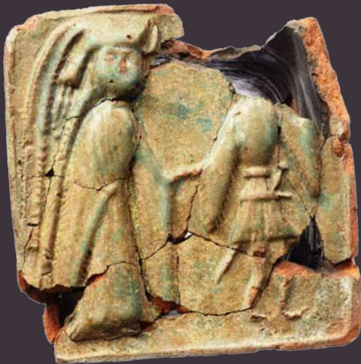
Koklis su šokėjų atvaizdu, XV a., Valdovų rūmų muziejus

idant tiek giedotojų, tiek muzikantų širdys pasidarytų jausmingesnės ir prisiskverb- tų giliau prie pačios Dievo esybės. Dėl to taip ir yra, kad, jei iš tiesų jaučiame Dievo Didenybę džiaugiantis muzika per pašlovinimus, tai neturime nėmaž stebėtis, kad muzika taip užvaldo žmones, taip nuveda juos kitapus savęs, kad jie jau laiko niekais beigi su panieka žiūri į visus kitus malonumus, palygintus su muzika. Gerai žinomas tasai dalykas, pasakojamas apie Aleksan- dro Didžiojo prieraišumą muzikai: nors jis ir troš- ko atrodyti išdidus bei rūstus pasaulio užkariau- tojas, tačiau kautynėms ruošdavosi bei prigimtine dvasios galią keldavo ne kaip nors kitaip, o tik jo muzikantui skambinant melodiją. Kai šis liaudavo- si, Aleksandras ramiai leisdavo laiką.