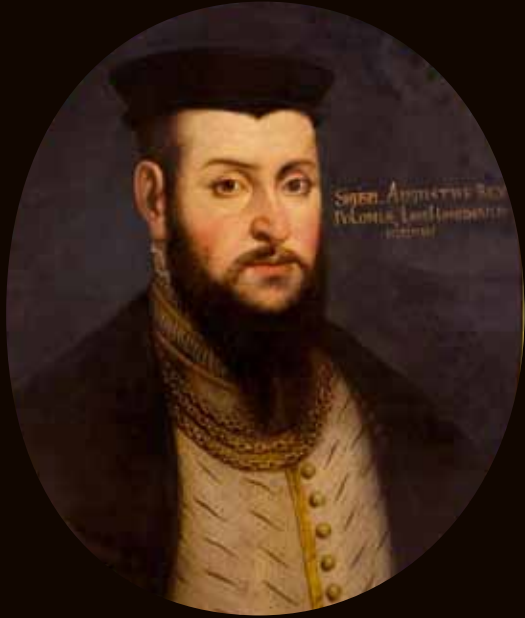
Lenkijos karaliaus ir Lietuvos didžiojo kunigaikščio Žygimanto Augusto (1520–1572) portretas, apie XVI a. vid., Krokuvos nacionalinis muziejus

Nėra žmogaus, kuris nežinotų, galingiausiasis karaliau, koks ryšys ir kokia proporcija sieja mūsų dvasią ir muzikinę harmoniją. Juk gi kiekvienas žmogus pats patiria, kad joks kitas dalykas labiau nepaveikia mūsų dvasios ir labiau jos nepradžiugina, kaip tiktai muzikos harmonija. Mat muzika šitaip pagauna dvasias ir taip jas, kur norėsi, pakreipia, kad jau senoliai, apdovanoti ypatinga išmintimi, kaip antai oriausiasis Sokratas, dieviškasis Platonas ir išmintingasis Pitagoras, tvirtino, kad ji esanti džiaugsmo, kuriuo grindžiamas veik visas žmogaus gyvenimas ar bent geresnioji jo dalis, kėlėja beigi kūrėja. Šie išminčiai taip aukštino muziką, kad manė ją esant susijusią su dieviškųjų dalykų išmanymu ir netgi tvirtino balsų bei stygų sąskambiuose glūdint pačią giliausią erudiciją. Jie taip ją aukštino, jog kalbėjo – dieviškosios išminties šviesa išsyk apšviesianti mūsų protą, vos tiktai į jį prasiskverbsianti dieviškosios muzikos jėga bei galia. Galop jie tvirtino mūsų dvasią esant ne ką kita, kaip tik muzikos instrumentą, sudarytą iš tokių pačių skaičių, iš kurių ir kylanti toji dermė bei nevienodų garsų vienovė, kelianti neįtikėtiną malonumą. Šiuo pagrindu jie muziką laikė pačiu seniausiu reiškiniu, savo pradžių vedančiu kartu su sielų sukūrimu.