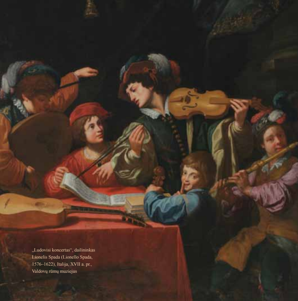
„Ludovisi koncertas“, dailininkas Lionelis Spada (Lionello Spada, 1576–1622), Italija, XVII a. pr., Valdovų rūmų muziejus

sekti. Ir kadangi dėl šios priežasties aš sukomponečiau kai kurias giesmes, melodijas ir kitus dalykus, reiškiamus liutnios garsais, Tu, maloningiausiasis karaliau, nors ir galėdamas įsakyti, vis dėlto mieliau teikeisi paraginti, kad aš jas išleisčiau į šviesą, o Tavo valiai nepaklusti būtų nedora – pasakyčiau, netgi begėdiška. Aš nusprendžiau paklusti Tavo norui, kuris man visada buvo tarsi orakulas, ir tuos kūrinčius parengiau spaudai, skirdamas juos gausiems didžiai garbingiems vyrams, kurie šito labai dažnai reikalavo iš manęs gauti.