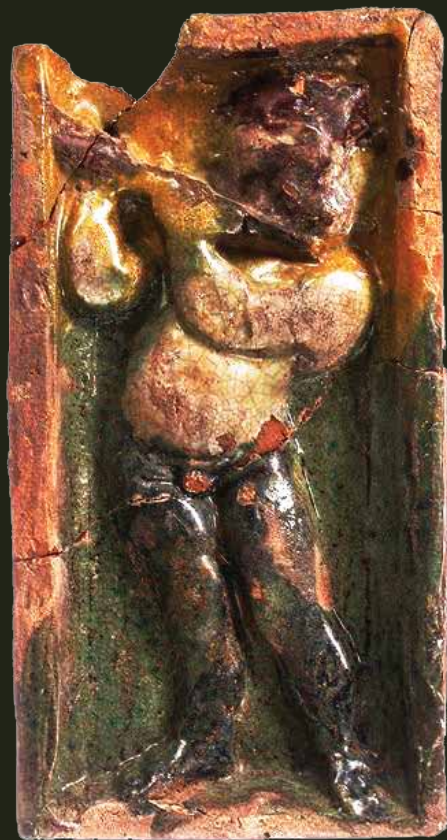
Renesansinis koklis su berniuko, grojančio fleita, atvaizdu, XVI a., Valdovų rūmų muziejus

dėstytojus šis vyras taip rėmė visomis įmanomomis dosnumo išraiškomis, kad dar jokių kitų laikotarpiu šis menas labiau neklestėjo – juk ta epocha davė gausybę iškiliausių muzikų, kurie ne tik po savęs paliko puikiausių kūrinų, bet ir patys pelnė dosningiausių apdovanojimų.