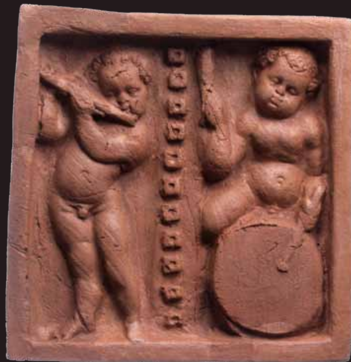
Renesansinis koklis su berniuko, mušančio būgną ir grojančio fleita, atvaizdu, XVI a., Valdovų rūmų muziejus